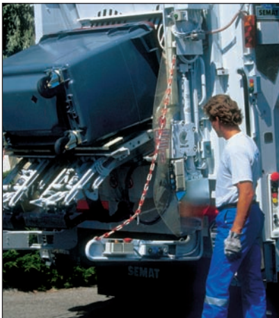
Le pesage des déchets permet une juste facturation aux entreprises.

tation qui impose aux entreprises de trier leurs déchets industriels ; réduction du coût de traitement par une valorisation maximale et une facturation, au réel, des quantités produites grâce à un système de pesée embarquée.