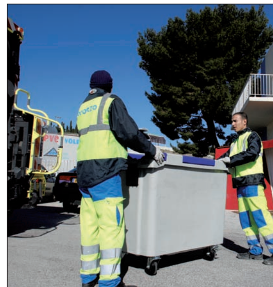
Bronzo gère la collecte sélective pour une valorisation optimale des déchets.