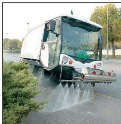
Le lavage des rues contribue à l'hygiène et au confort urbain.

Balayer et laver les rues, les places publiques, les trottoirs ainsi que tout espace livré à la circulation des véhicules et des piétons, constituent autant de missions assurées quotidiennement par un personnel expérimenté et doté des matériels les plus performants.