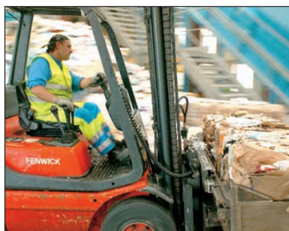
Le centre de tri, une étape incontournable avant la valorisation.