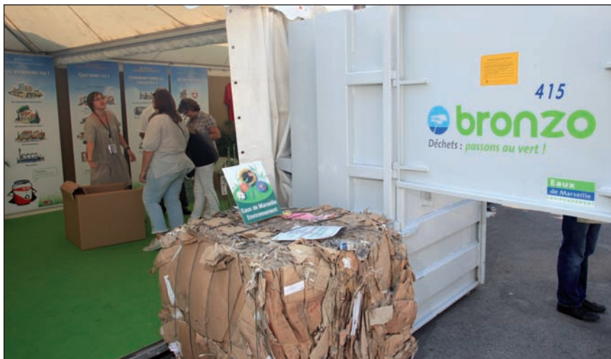
Bronzo conduit une action pédagogique soutenue pour sensibiliser particuliers et entreprises au tri et à la bonne gestion des déchets.

Depuis son étude jusqu'à sa mise en œuvre, Bronzo maîtrise la collecte des déchets ménagers, qu'elle soit traditionnelle au porte-à-porte ou sélective et en double poubelle.