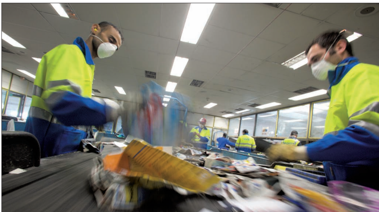
Tri manuel en cabine insonorisée et climatisée.

Cette démarche, qui permet de mutualiser les coûts entre les entreprises d'une même zone, présente de nombreux avantages : protection de l'environnement ; respect de la réglemen-