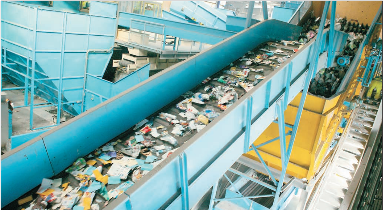
Le centre de tri d'Aubagne est doté d'une chaîne de tri ultra-performante.

tation qui impose aux entreprises de trier leurs déchets industriels ; réduction du coût de traitement par une valorisation maximale et une facturation, au réel, des quantités produites grâce à un système de pesée embarquée.