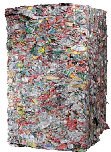
Balle de canettes d'aluminium prête à être expédiée dans une usine de valorisation

Ces derniers constituent des matières premières, dites de deuxième génération, dont la qualité et le conditionnement doivent répondre à un cahier des charges précis, fixé par les industries utilisatrices.