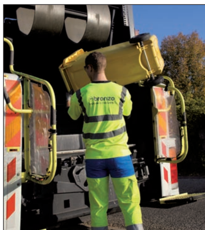
Collectes sélectives des déchets ménagers en bacs individuels.

SPÉCIALISÉE DANS LA GESTION DES DÉCHETS, ENJEU MAJEUR POUR NOTRE VIE QUOTIDIENNE, BRONZO MET, DEPUIS PLUS DE 40 ANS, SON EXPÉRIENCE AU SERVICE DES COLLECTIVITÉS LOCALES, DES INDUSTRIELS ET DES CITOYENS PROVENÇAUX.